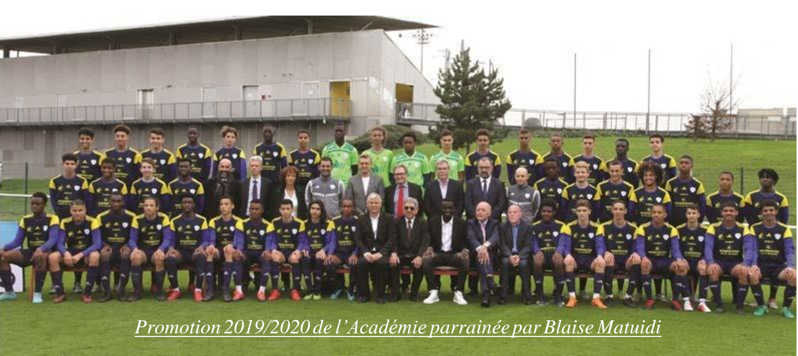
Promotion 2019/2020 de l'Académie parrainée par Blaise Matuidi

Section sportive football – Académie de football US Créteil