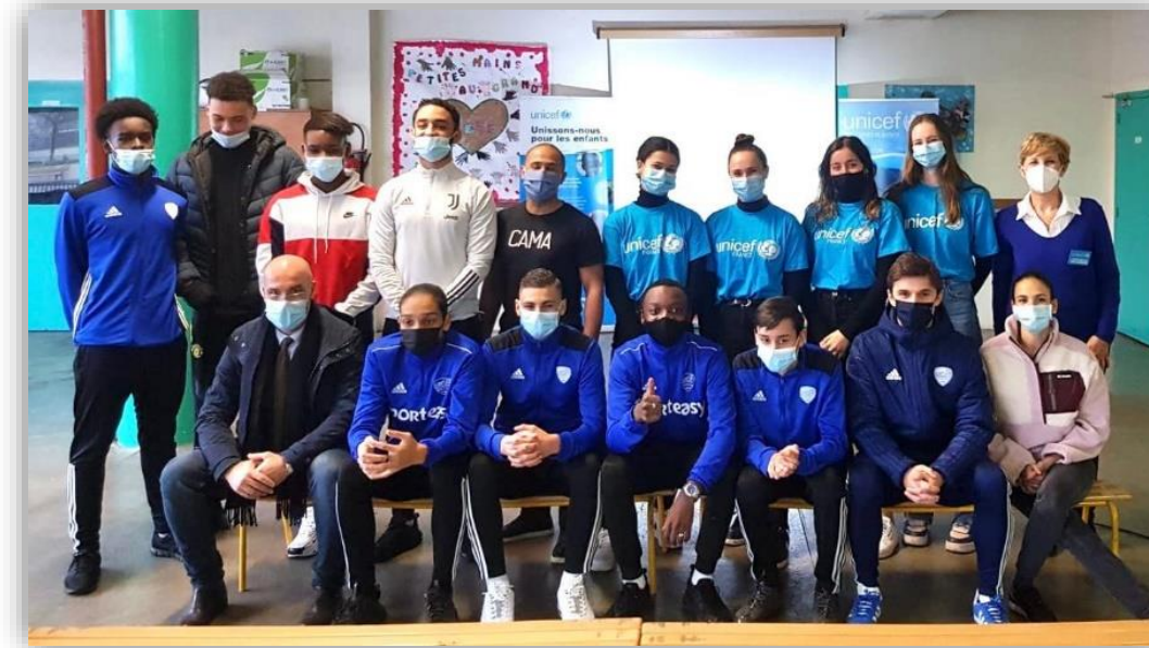
Projet Citoyen en association avec l'UNICEF – Janvier 2021