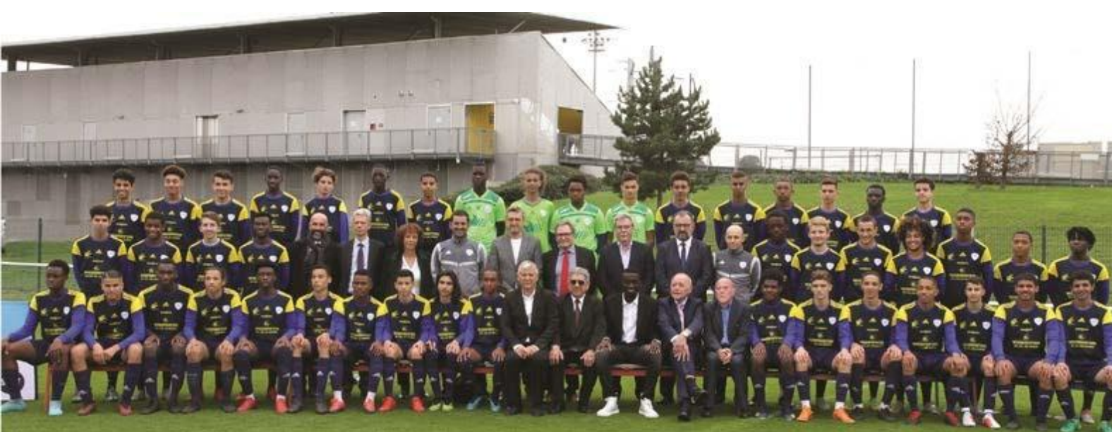
Promotion 2019/2020 de l'Académie parrainée par Blaise Matuidi

La validation du dossier scolaire est soumise aux chefs d'établissement et à la signature de la convention de formation, du règlement intérieur et de la charte interne.