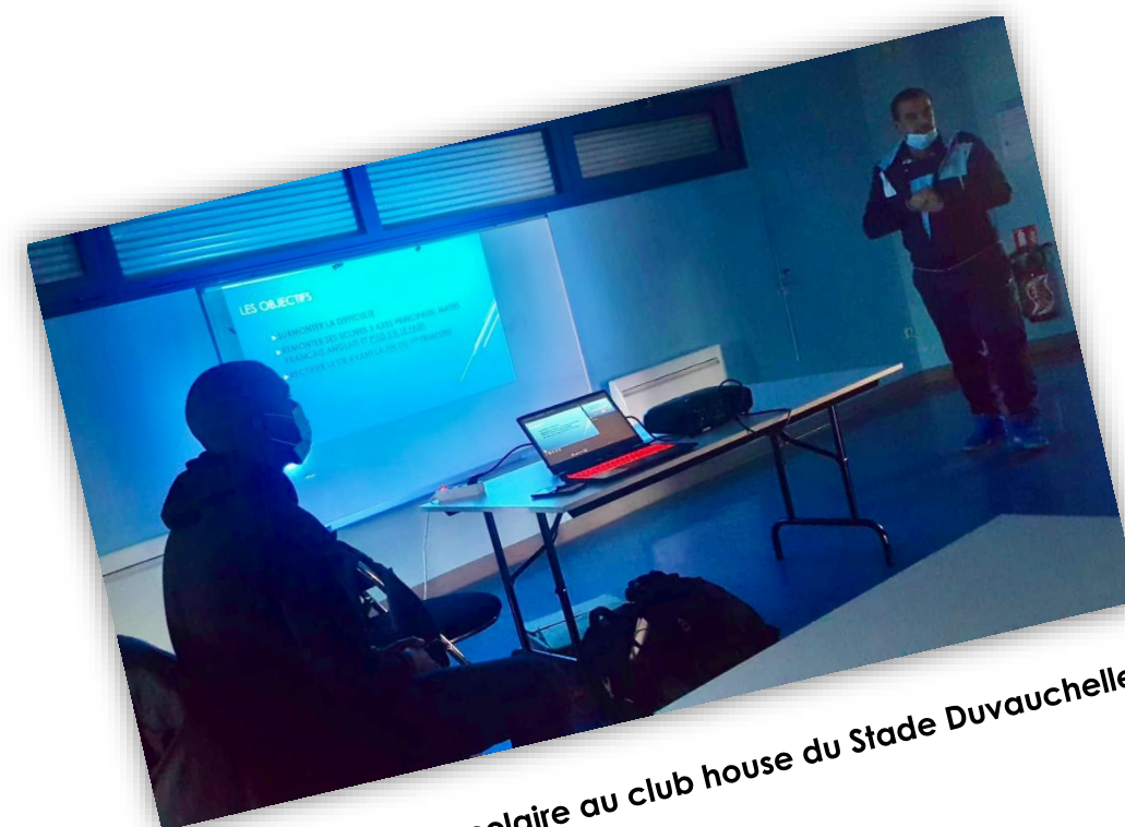
Séance de soutien scolaire au club house du Stade Duvauchelle