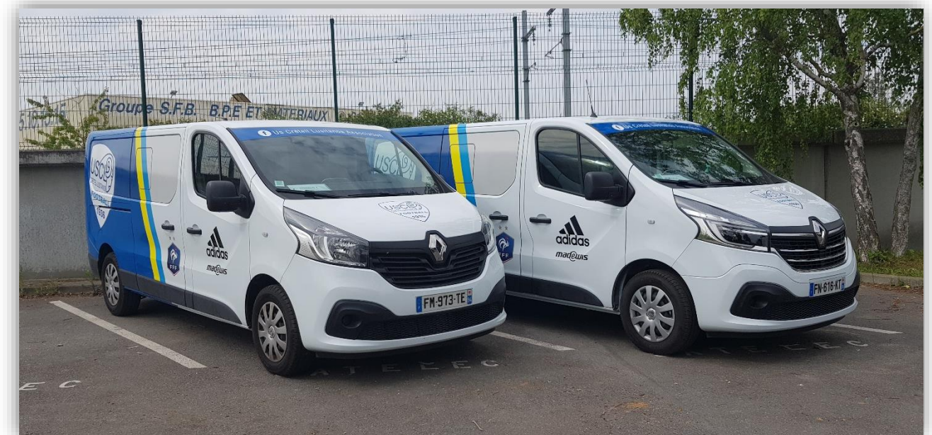
Flotte de deux minibus

Flotte de deux minibus appartenant au club aux couleurs de ce dernier et des partenaires pour assurer le transport des joueurs de l'Académie à la sortie des cours pour se rendre sur les lieux de l'entraînement.