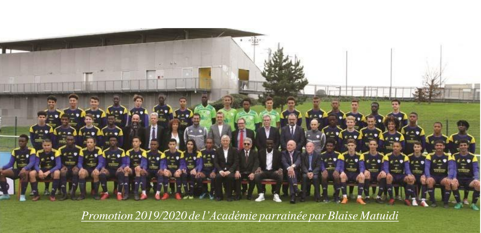
Promotion 2019/2020 de l'Académie parrainée par Blaise Matuidi

Section sportive football – Académie de football US Créteil